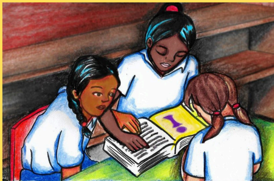
Ilustración: Carla G. Núñez