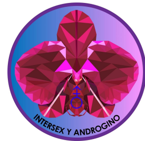
Intersex y Andrógino (México)