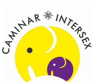
Caminar Intersex (España)