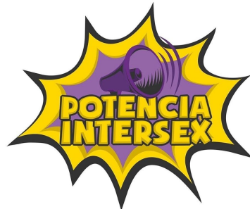
Potencia Intersex (Argentina)