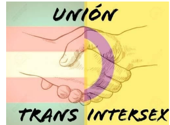
Unión Trans Intersex (Argentina)