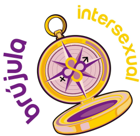
Brújula Intersexual (México)